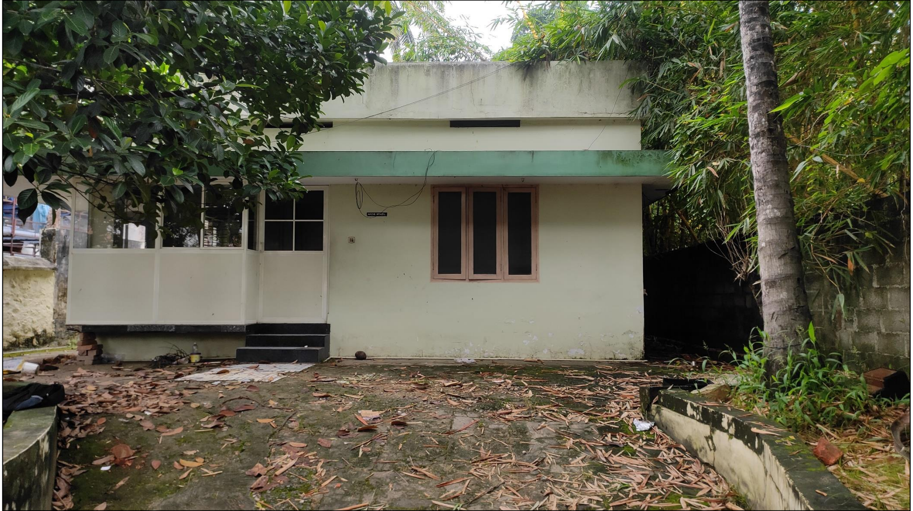
2.Smt Seenath Beevi